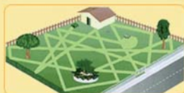
il percorso "random"