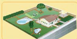
la delimitazione del giardino

Funziona in modo intelligente e silenzioso, con possibilità di programmare l'orario di lavoro. E' anche dotato di un sensore pioggia.