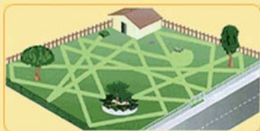
il percorso "random"