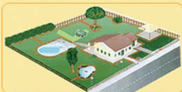
la delimitazione del giardino

Funziona in modo intelligente e silenzioso, con possibilità di programmare l'orario di lavoro. E anche dotato di un sensore pioggia.