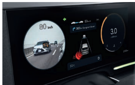
Blind View Monitor